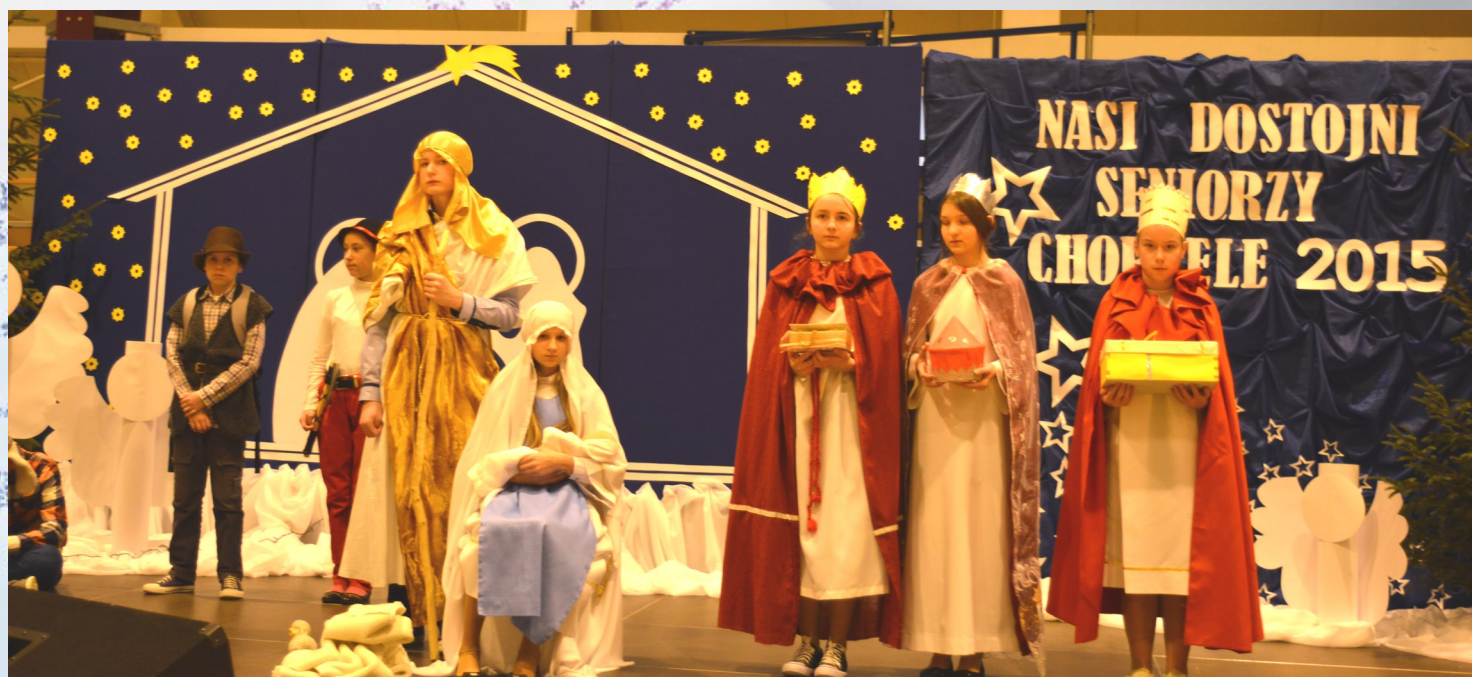
Świąteczne spotkanie Bożonarodzeniowe z Seniorami, jasełka w wykonaniu uczniów Zespołu Szkół w Duczyminie

Pismo Mieszkańców Miasta i Gminy Chorzele