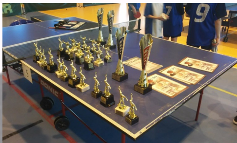
CHŁOPCY - 2004.2003