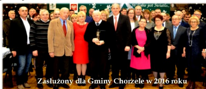
Zasłużony dla Gminy Chorzele w 2016 roku