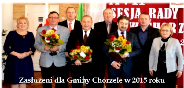
Zasłużeni dla Gminy Chorzele w 2015 roku