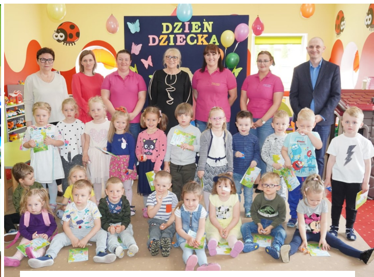
Grupa Biedronki — Żłobek Miejski w Chorzelach