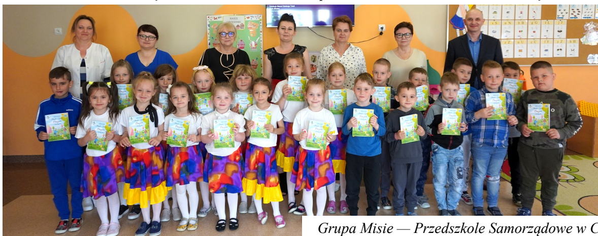
Grupa Misie — Przedszkole Samorządowe w Chorzelach