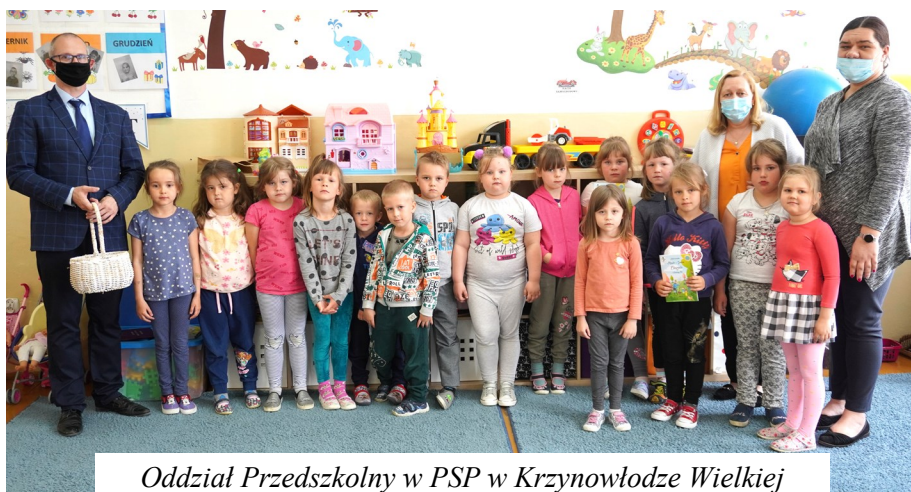
Oddział Przedszkolny w PSP w Krzynowłodze Wielkiej