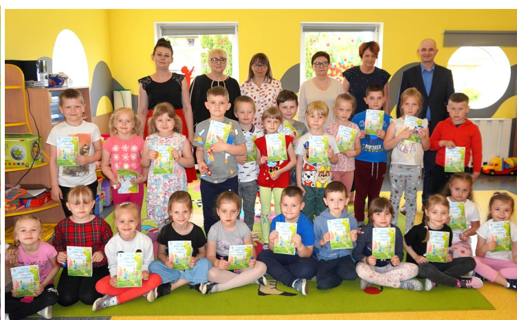
Grupa Pszczołki — Przedszkole Samorządowe w Chorzelach