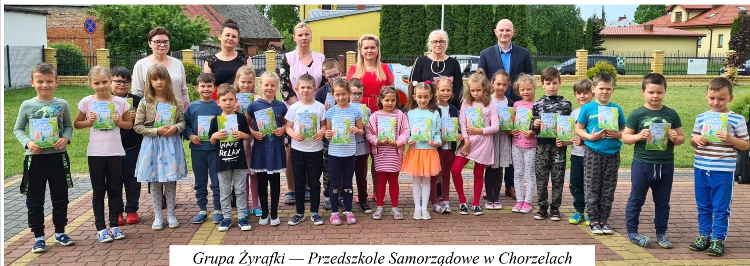
Grupa Żyrafski — Przedszkole Samorządowe w Chorzelach