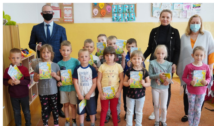
Oddział Przedszkolny w PSP w Krzynowłodze Wielkiej