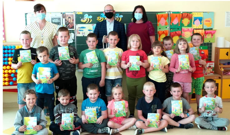
Oddział Przedszkolny w PSP w Zarębach