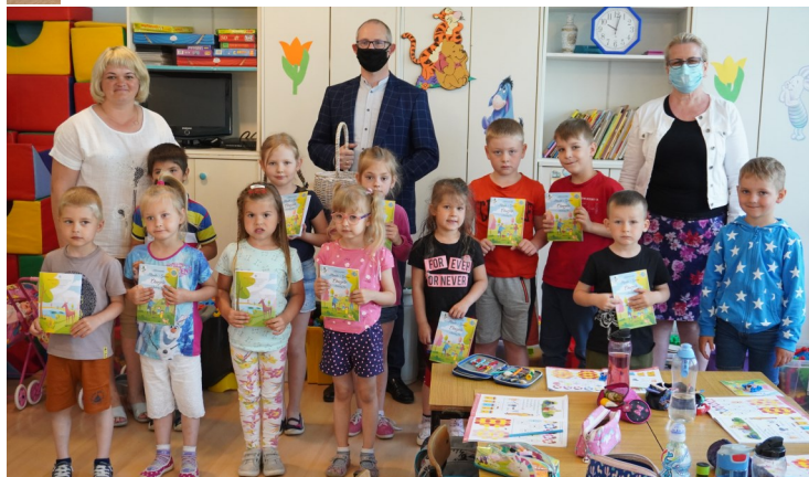
Oddział Przedszkolny w PSP w Pościeniu Wsi