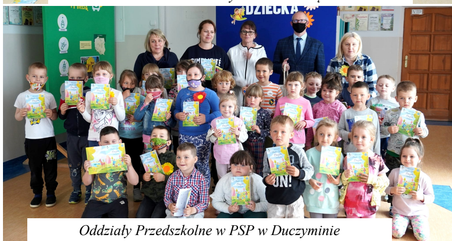
Oddziały Przedszkolne w PSP w Duczyminie