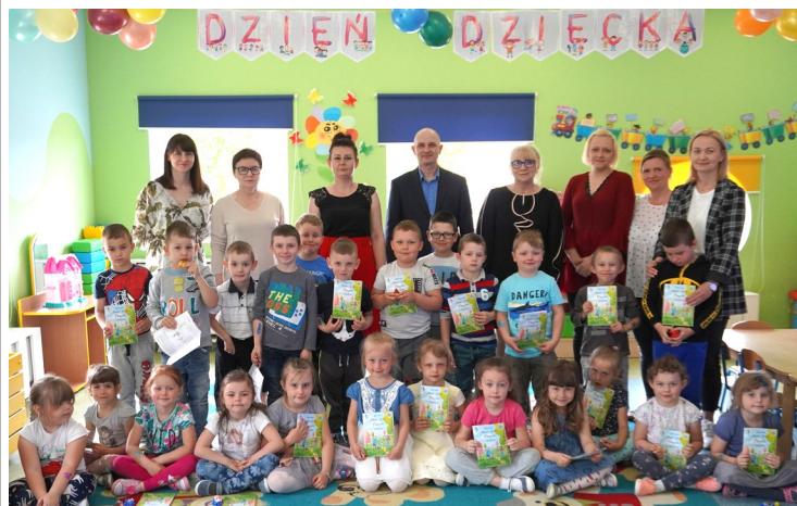
Grupa Motylki — Przedszkole Samorządowe w Chorzelach