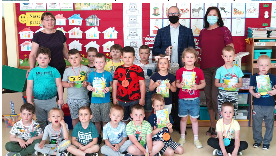
Oddział Przedszkolny w PSP w Zarębach