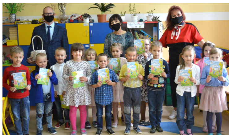
Oddział Przedszkolny w PSP w Krukowie