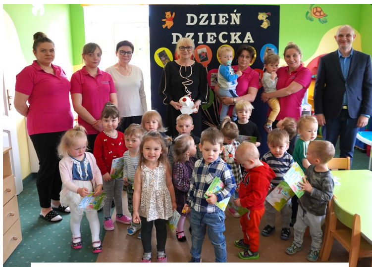
Grupa Żółwki — Żłobek Miejski w Chorzelach

Poniżej prezentujemy pamiątkowe zdjęcia z naszymi Przedszkolakami: