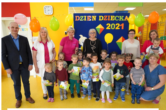
Klub Dziecięcy w Chorzelach