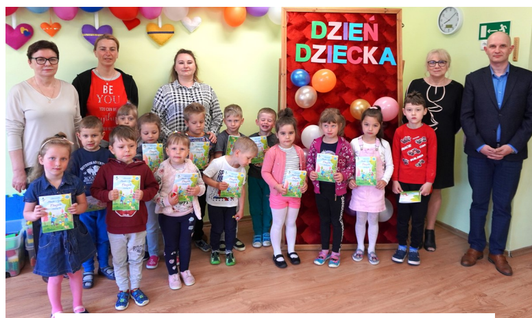
Grupa Smerfiki — Przedszkole Samorządowe w Chorzelach, Oddział w Łazie