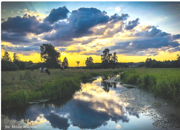
fot. Miłosz Milewski