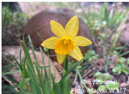
narcyz żonkil

gdzie masz blisko!”- Igor F; „Gdy myjesz zęby pamiętaj o zakręcaniu wody, bo to duża strata dla przyrody!” – Wojciech W.