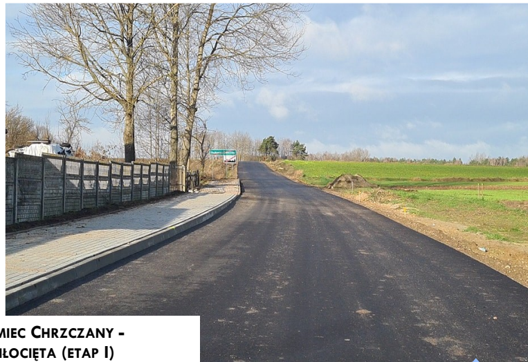
DROGA GADOMIEC CHRZCZANY - GADOMIEC MIŁOCIĘTA (ETAP I)