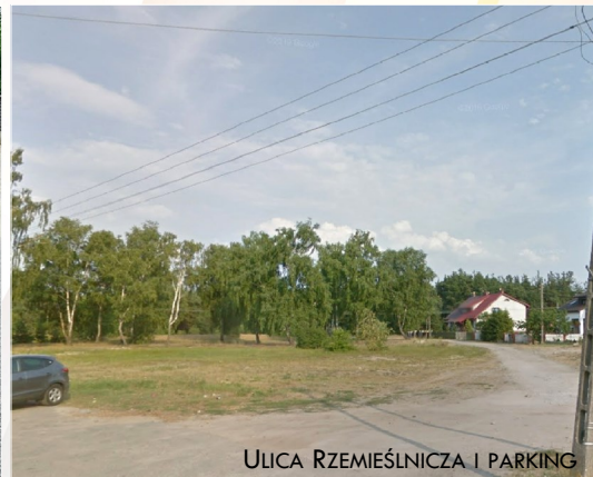
ULICA RZEMIEŚLNICZA I PARKING