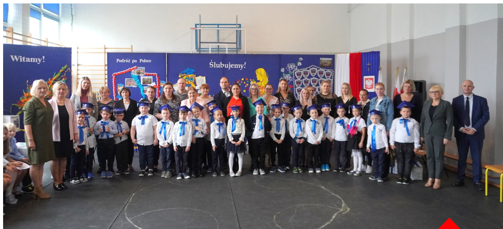
Ślubowanie klasy pierwszej w PSP w Zaręczach.