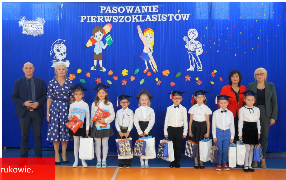
Ślubowanie klasy pierwszej w PSP w Krukowie.