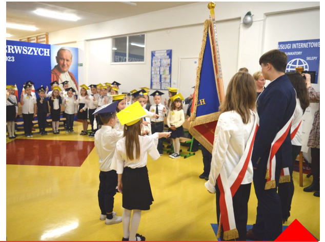
Ślubowanie klas pierwszych w PSP nr 2 w Chorzelach.