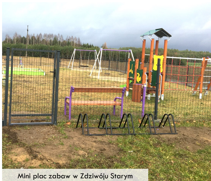
Mini plac zabaw w Zdziwóju Starym