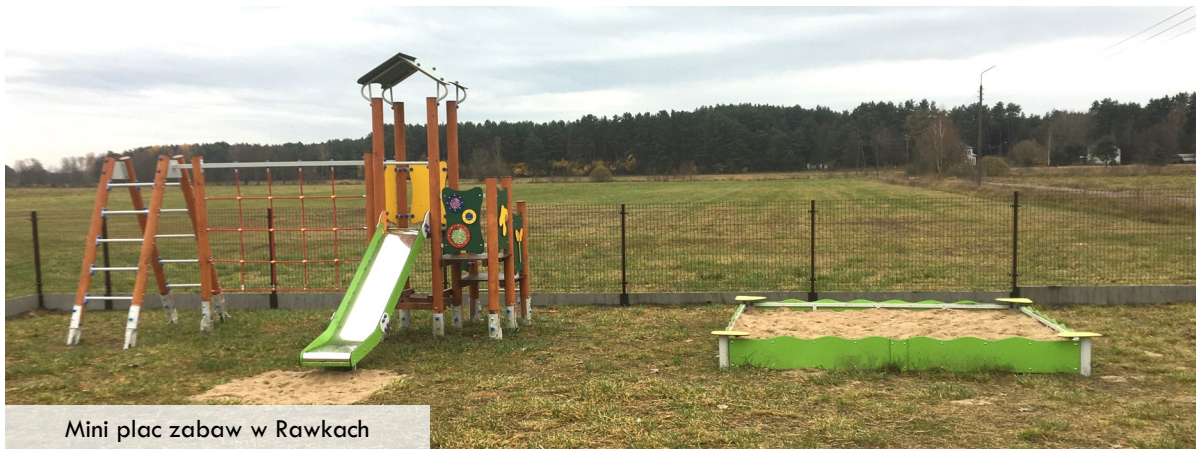
Mini plac zabaw w Rawkach

Przyznana kwota pomocy ze środków samorządu województwa dla każdego zadania to 10 tys. zł. Pozostałe środki gmina zabezpieczyła, jako wkład własny.