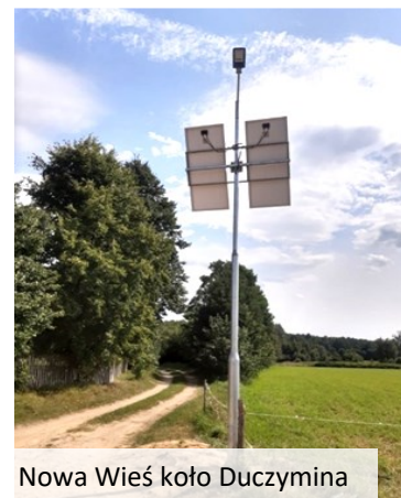
Nowa Wieś koło Duczymina