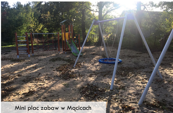
Mini plac zabaw w Mącicach