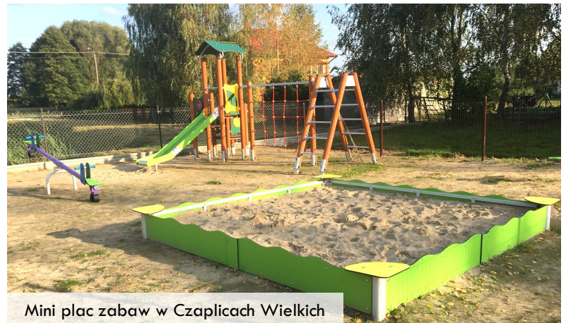
Mini plac zabaw w Czaplicach Wielkich