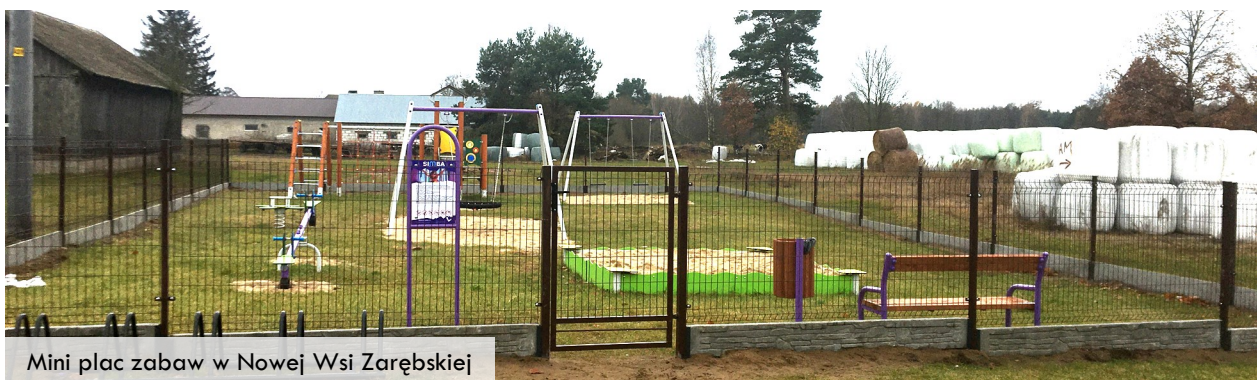
Mini plac zabaw w Nowej Wsi Zarębskiej