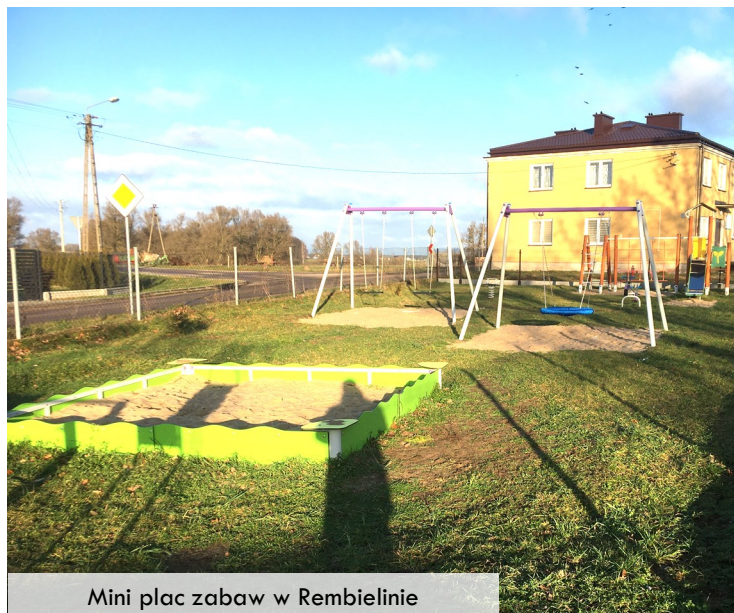
Mini plac zabaw w Rembielinie